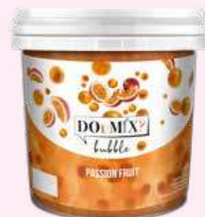
PASSION FRUIT COD.24414