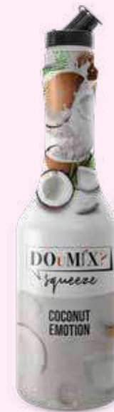
COCONUT EMOTION COD.21107