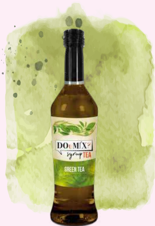
GREEN TEA COD.22615A