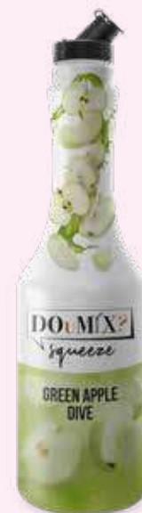
GREEN APPLE DIVE COD.21121