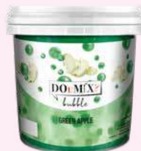
GREEN APPLE COD.24411