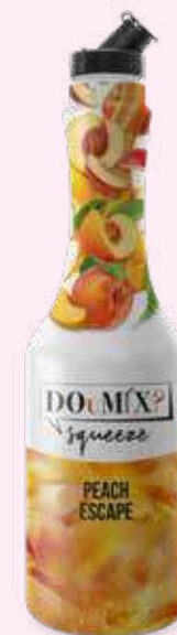
PEACH ESCAPE COD.21103