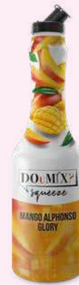
MANGO ALPHONSO GLORY COD.21100