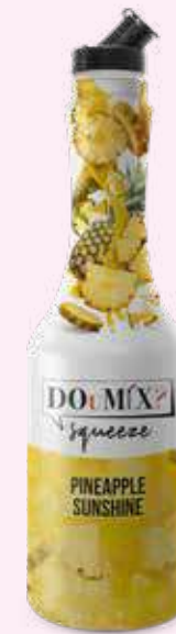
PINEAPPLE SUNSHINE COD.21112