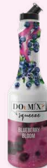
BLUEBERRY BLOOM COD.21106