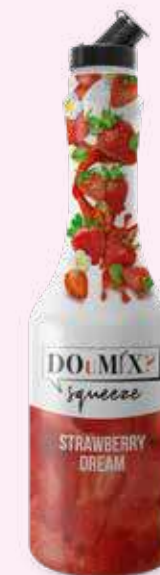
STRAWBERRY DREAM COD.21102